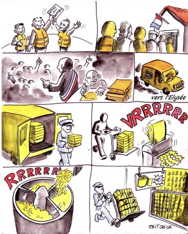
Au final le papier utilisé, payé avec nos impôts, profite au capital et à la grande distribution.

Résultats du sondage sur la participation au débat de Macron dans les mairies.